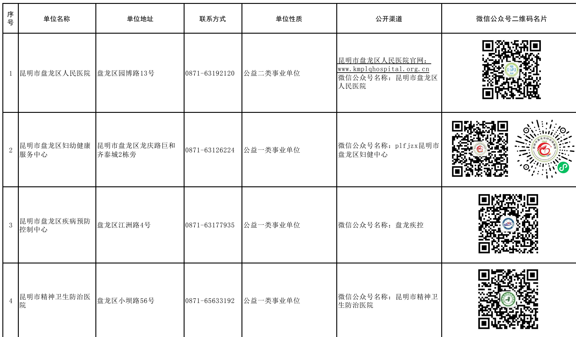
盘龙区基层卫生健康领域公共企事业单位基本信息表